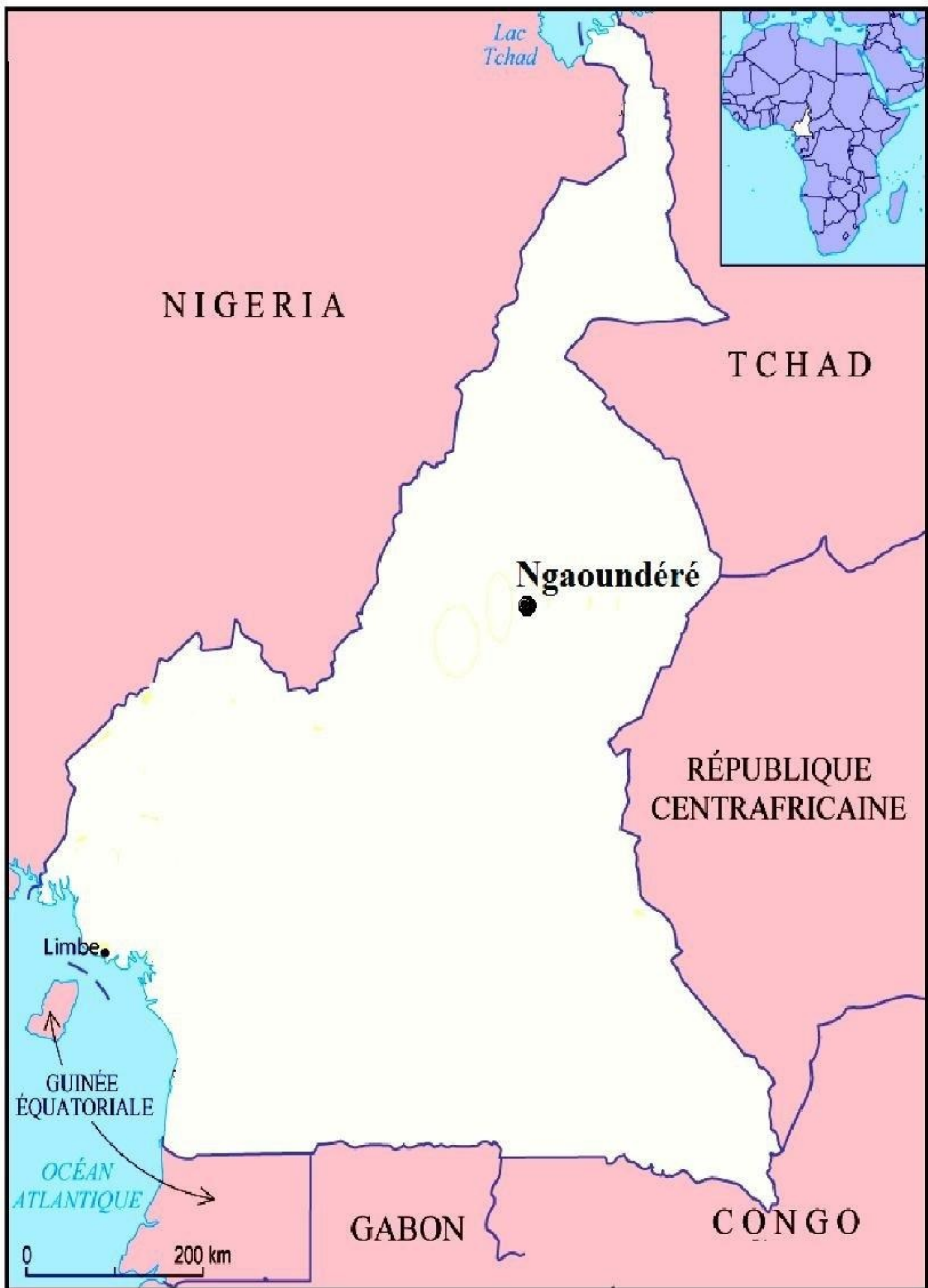
Localisation de la ville de Ngaoundéré

LE COMPETING - BET Complexe d'Etude d'Ingénierie