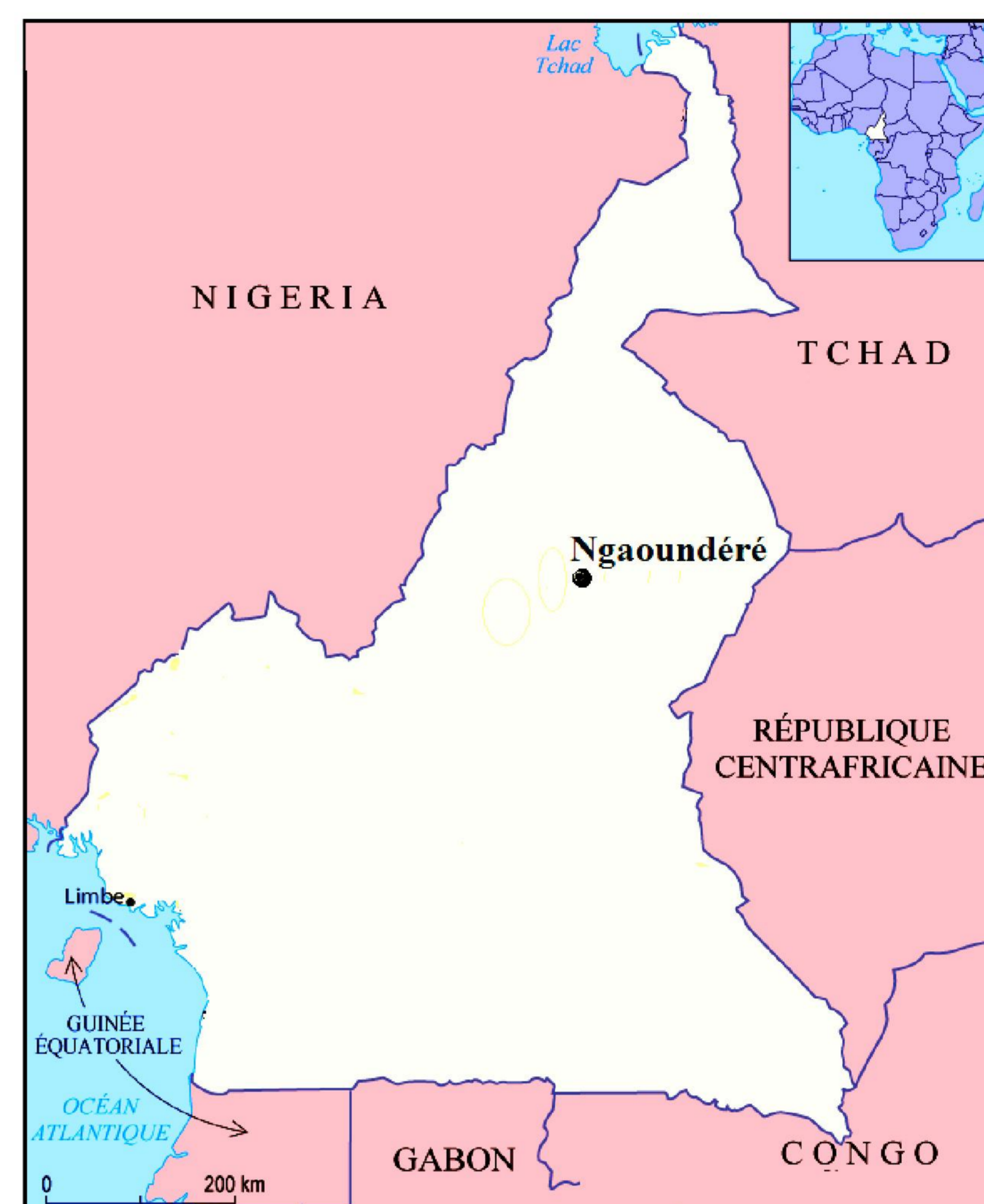
Localisation de la ville de Ngaoundéré