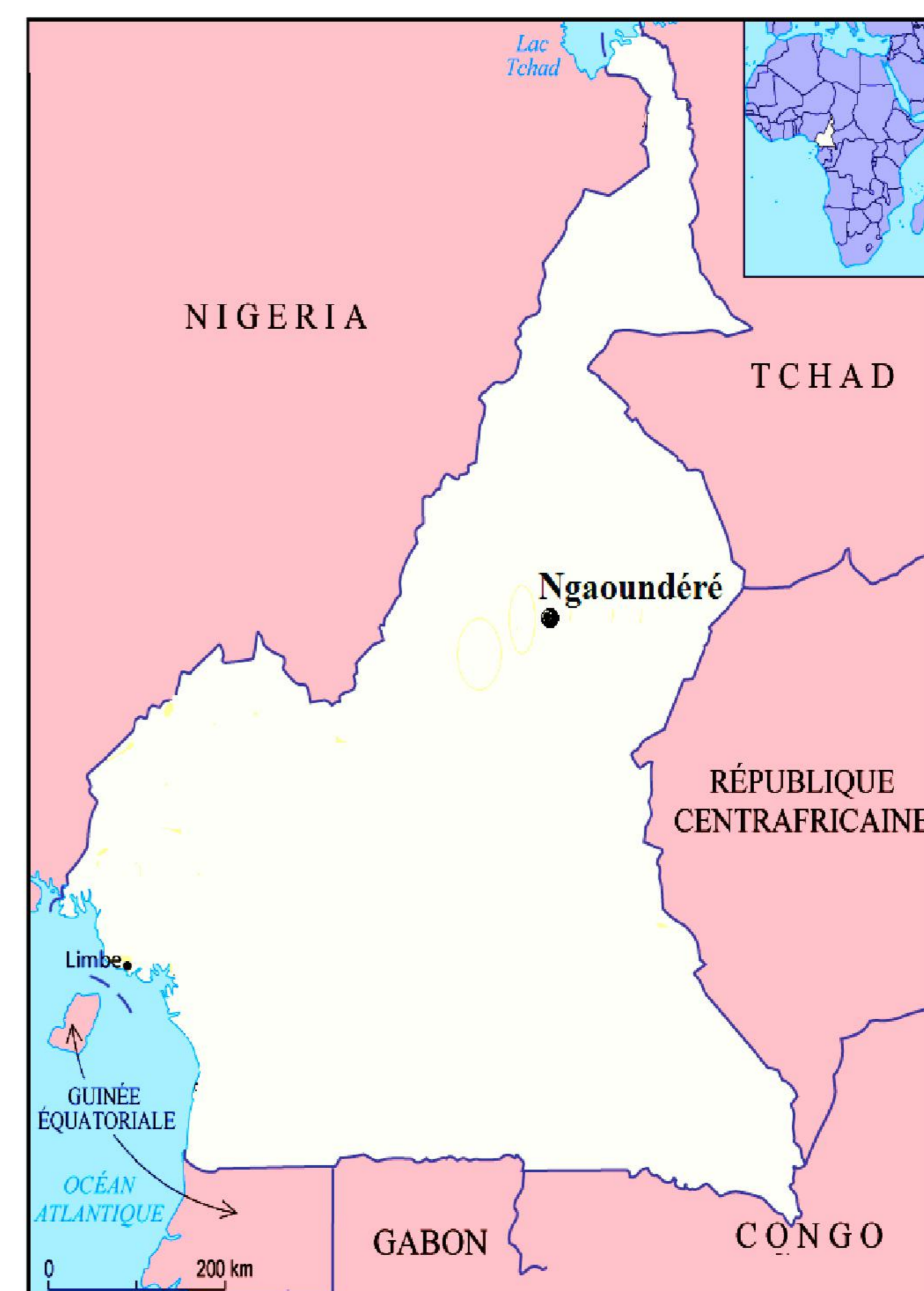
Localisation de la ville de Ngaoundéré

LE COMPETING - BET Complexe d'Etude d'Ingénierie