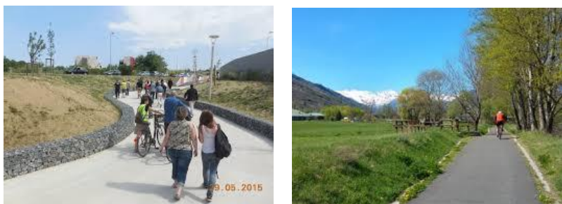
Exemple de piste piétonne proposée