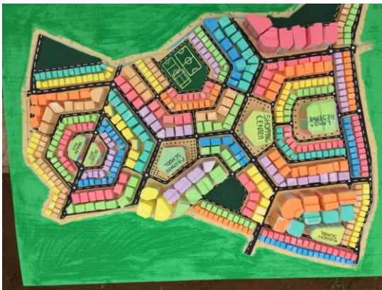
Polygone Sarl, 2018

Dans le cadre du plan de restructuration du quartier Sisia et de l'aménagement du site de recasement de Mbung, l'affiche de communication servira de base d'information qui pourra être utilisée chaque fois qu'une présentation sera nécessaire. Il peut s'agir d'une maquette du site de recasement aménagé, d'un plan d'aménagement sous grand format (A0) du site de restructuration progressive du quartier Sisia, affiché à des endroits stratégiques dans les différents blocs du quartier, voire encore d'un plan d'aménagement des chutes ou des pentes et talus.