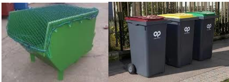
Exemple de bacs à ordure proposé