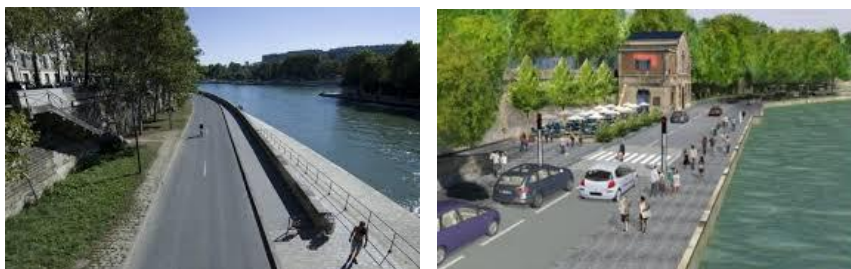
Exemple de voie sur berge le long du cours d'eau proposée