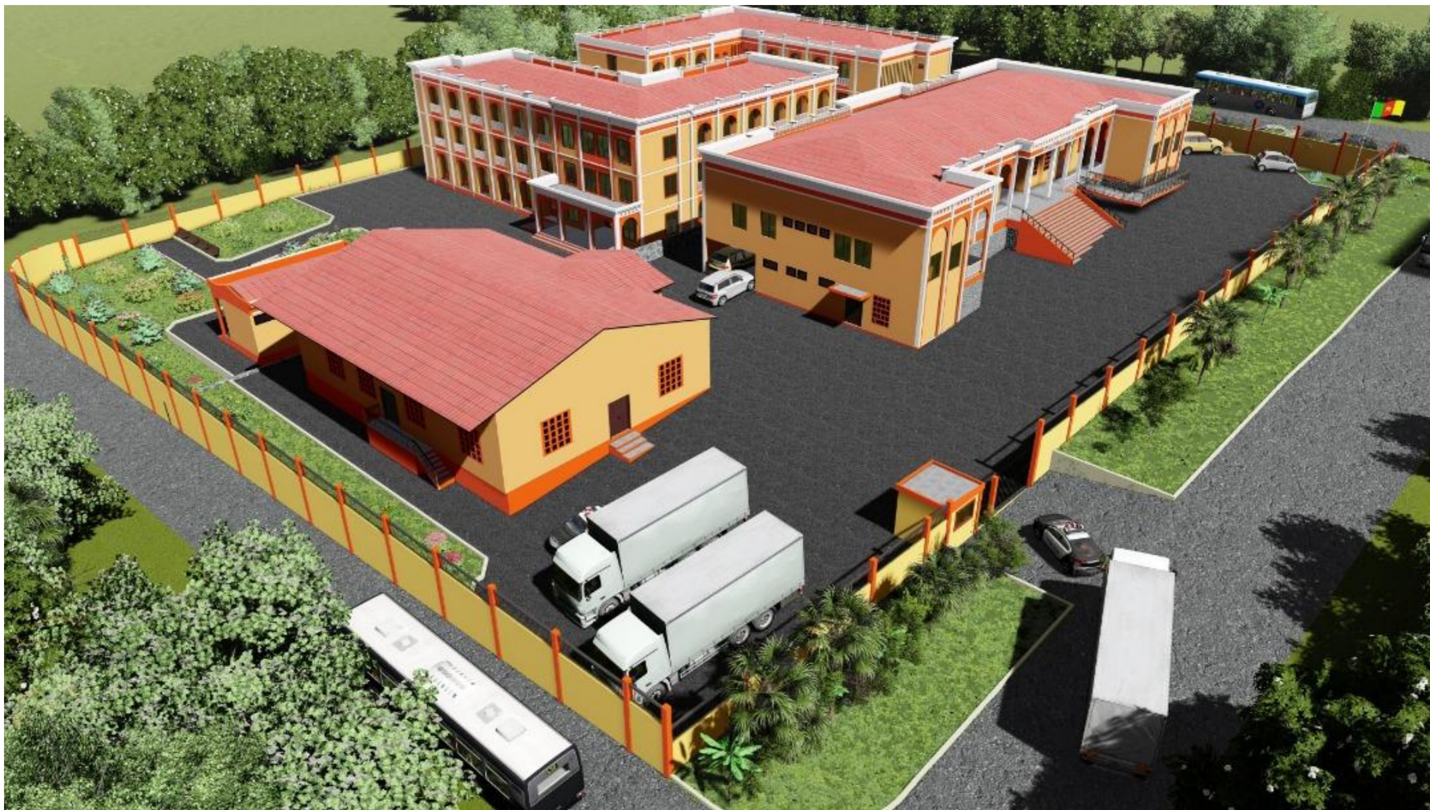
VUE PANORAMIQUE NORD-EST DU SITE