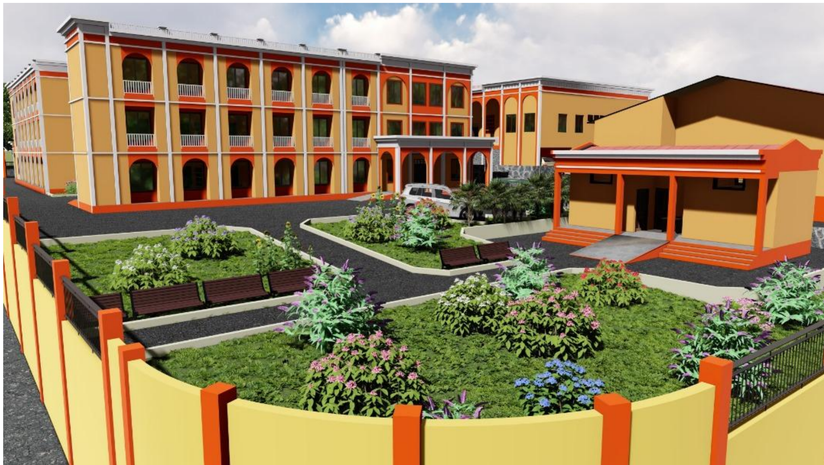
VUE PANORAMIQUE EST : BANCS PUBLICS ET ESPACE VERT A PROXIMITE DU BLOC TOILETTE EXTERNE