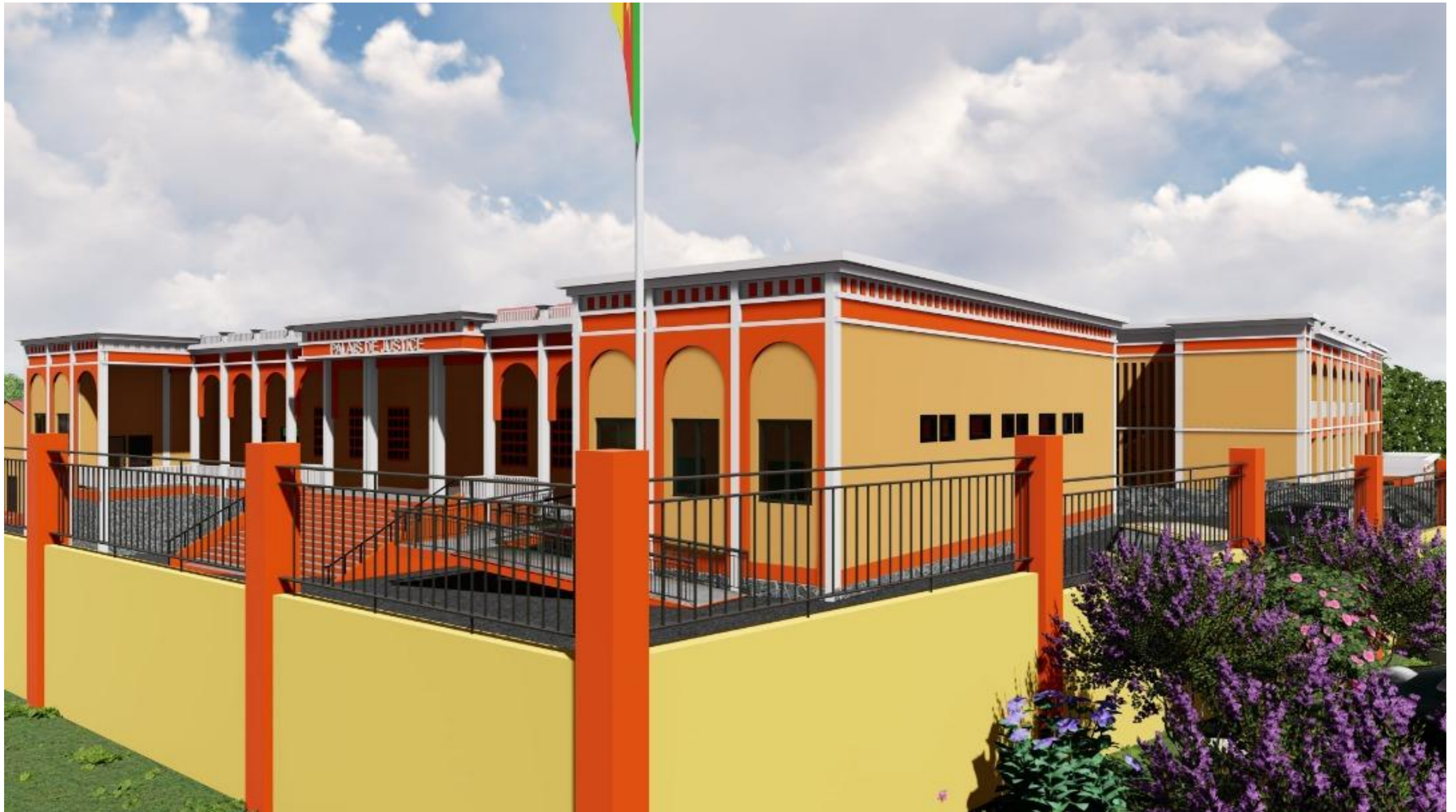
VUE OUEST DU SITE