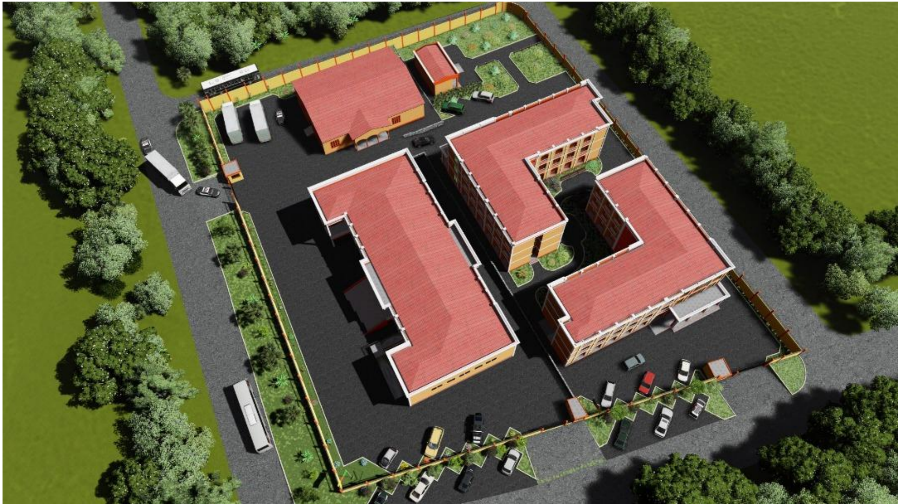
VUE AERIENNE DU SITE