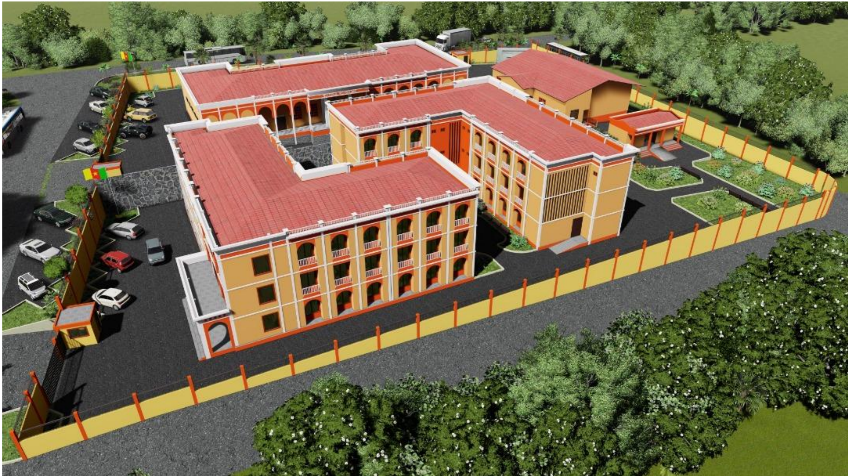
VUE PANORAMIQUE SUD-EST DU SITE