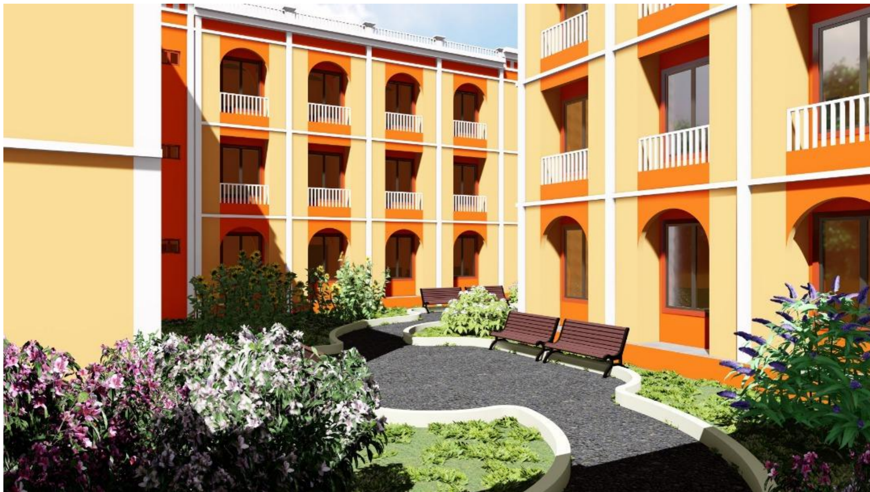
ESPACE VERT ET BANCS PUBLICS A PROXIMITE DES BATIMENTS DE BUREAUX