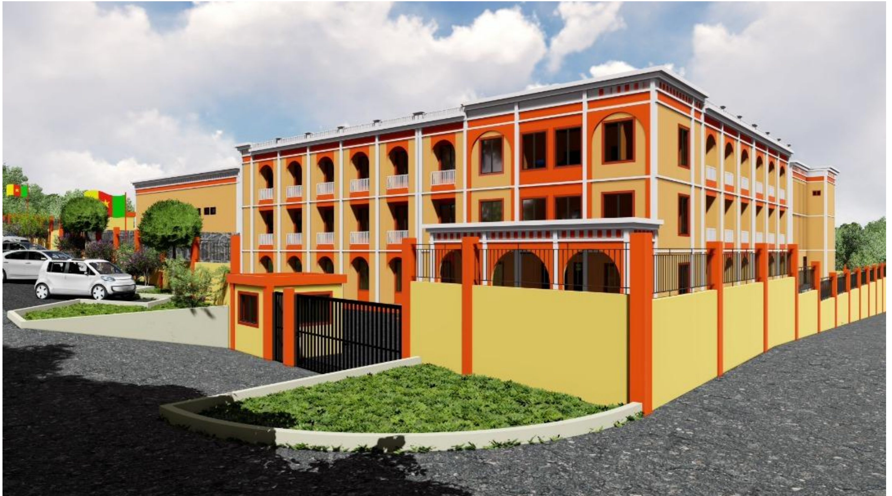
VUE SUD-OUEST DE L'ENTREE DU SITE